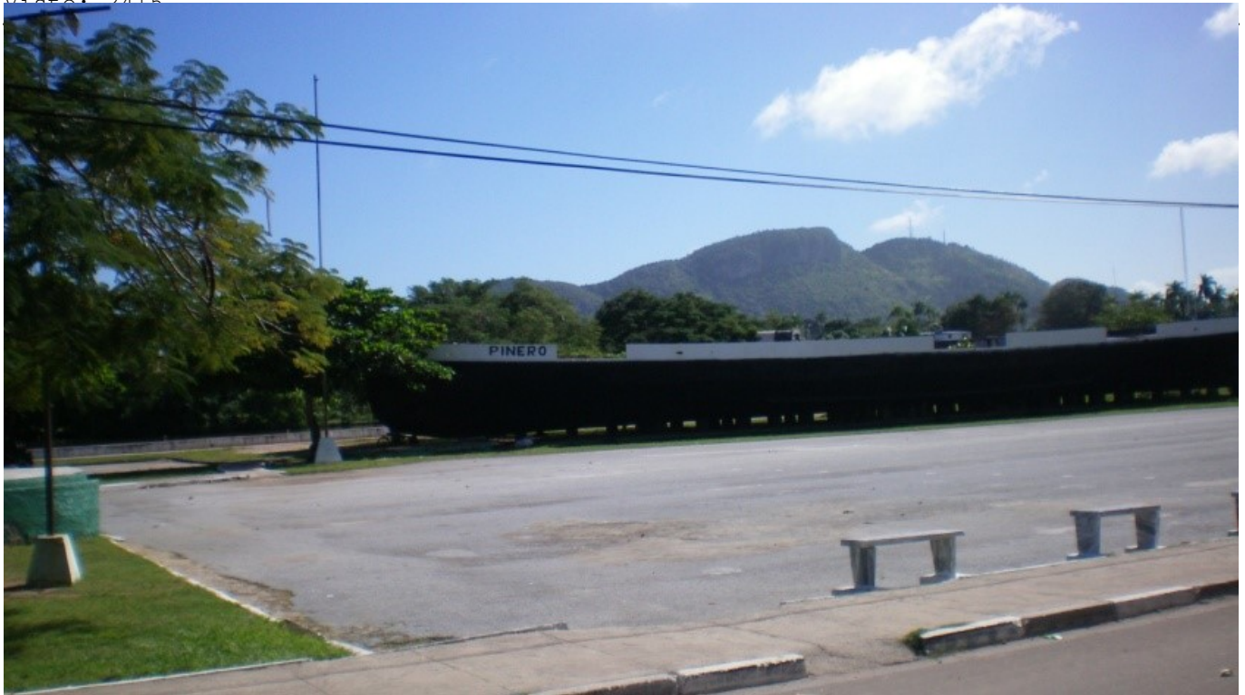
Plaza "Pinero" en Nueva Gerona.

El escudo pinero , como el cubano, tiene forma de adarga ojival suiza. Los dos extremos superiores del único cuartel que lo conforma, están cortados. Sobresale en el centro, en primer plano, la representación de un pino criollo cuyas ramas llegan al borde superior. Al fondo del mencionado cuartel se encuentran tres colinas, y detrás de ellas la mitad del disco solar con varios haces de luz, que abarcan casi la mitad del símbolo local. Una rama de encina y otra de laurel, cuyas puntas se entrecruzan en la parte inferior externa, orlan por la derecha e izquierda respectivamente, la silueta del escudo. La cúspide está rematada por una estrella blanca de cinco puntas.